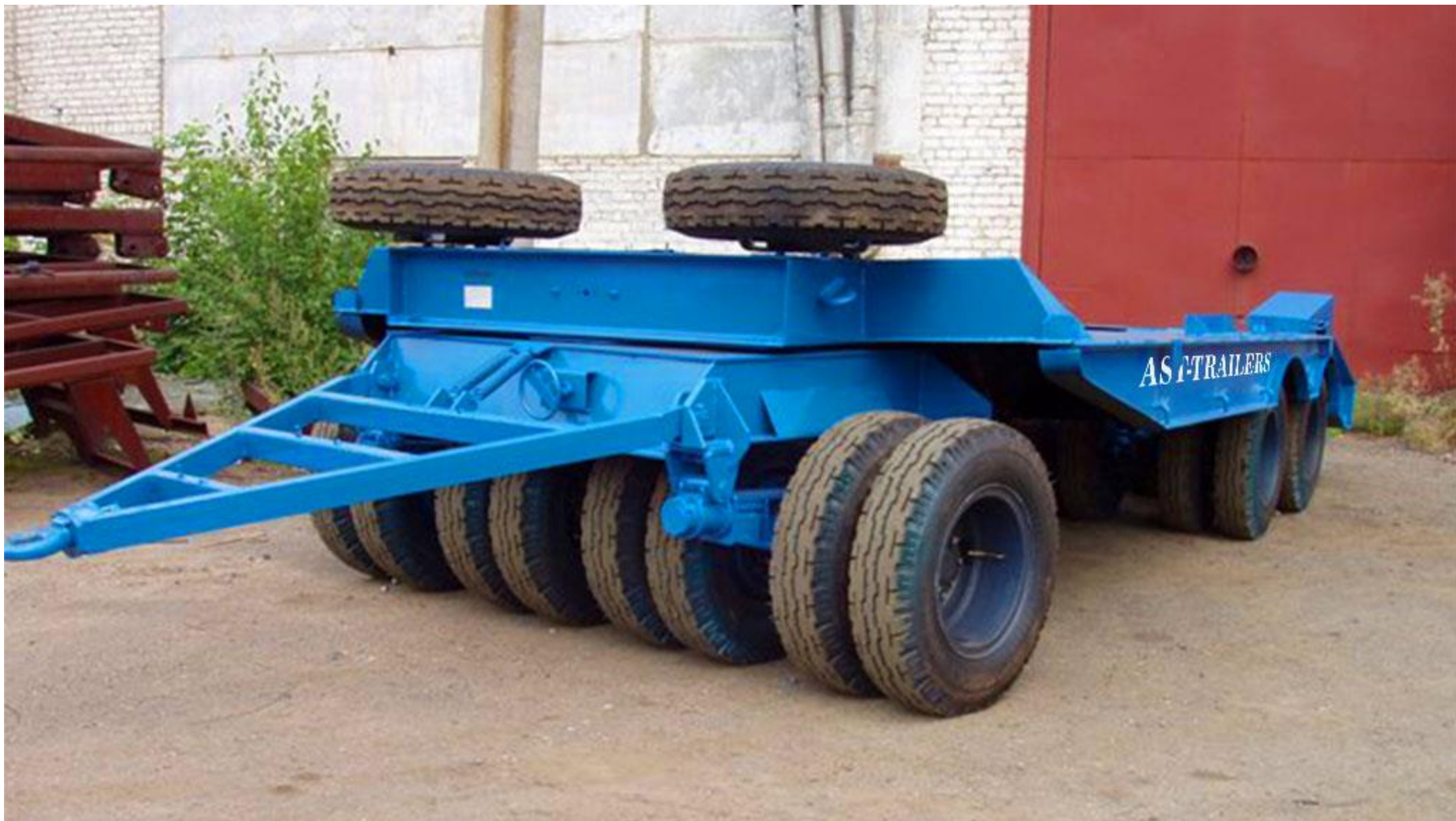
Прицеп 949171-1.2-06-40 (тяжеловоз)