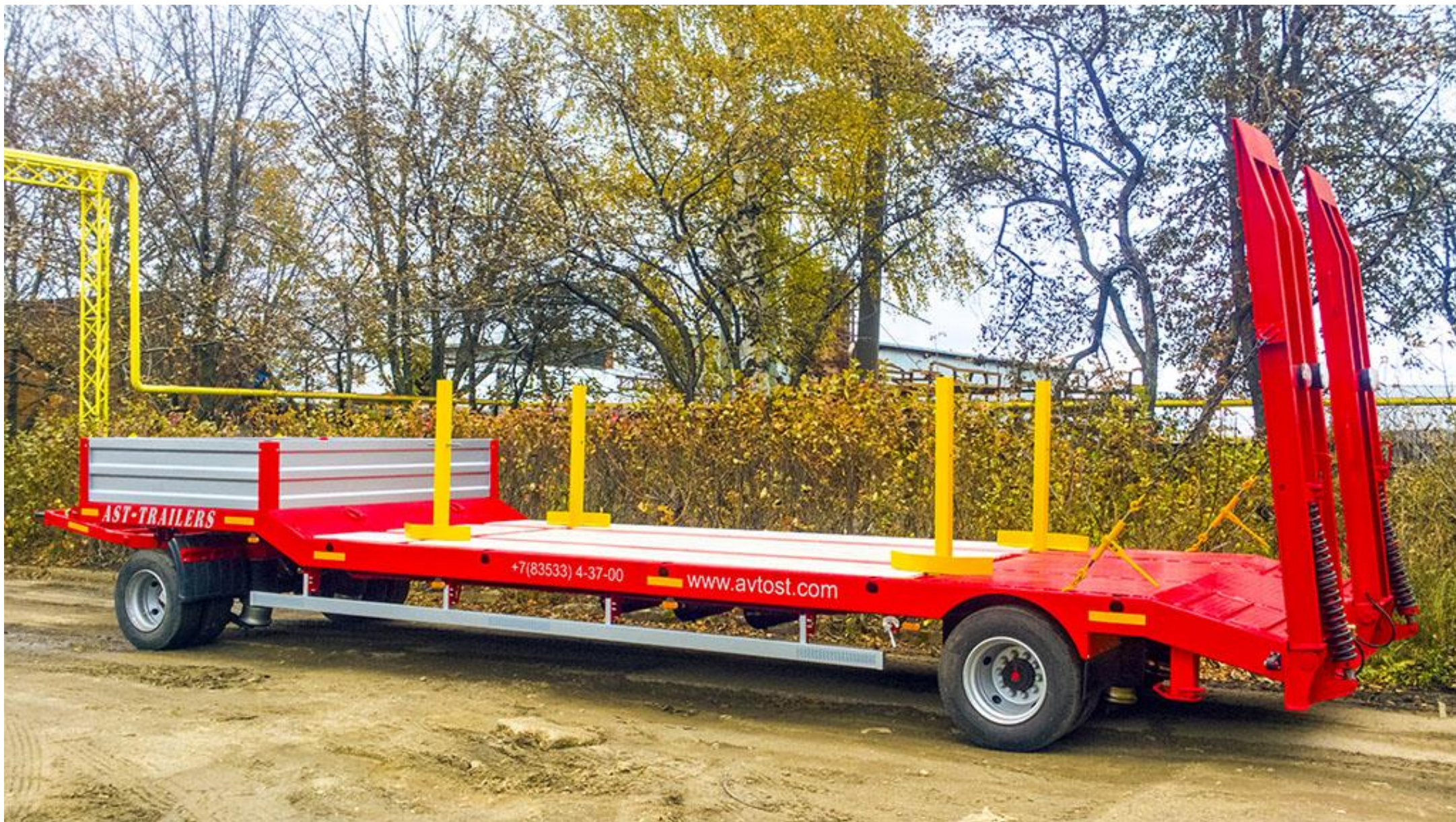
Прицеп 949164 (тяжеловоз)