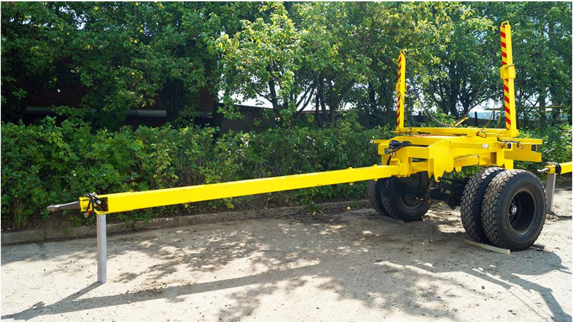
Прицеп 949173-Р8 (ропуск)