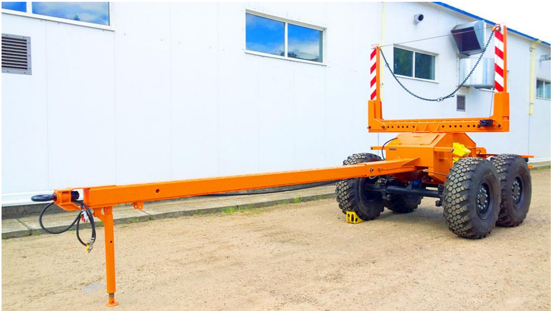
Прицеп 949173-ПР16 (ропуск)