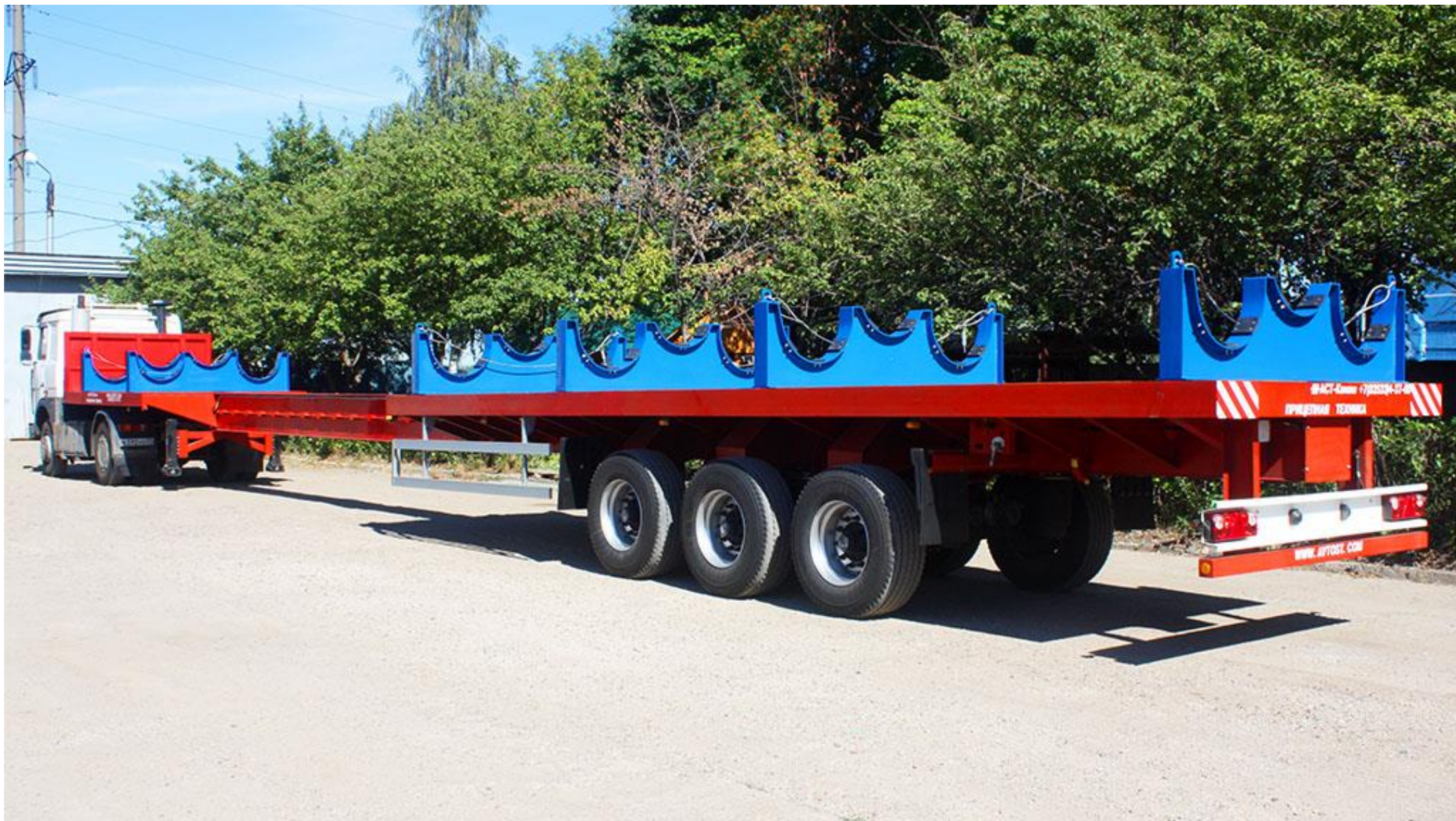
Полуприцеп 949140 (раздвижной)