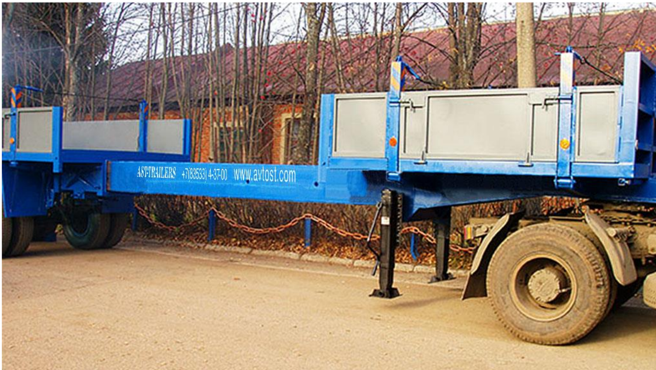
Полуприцеп 949151-02 (платформа)