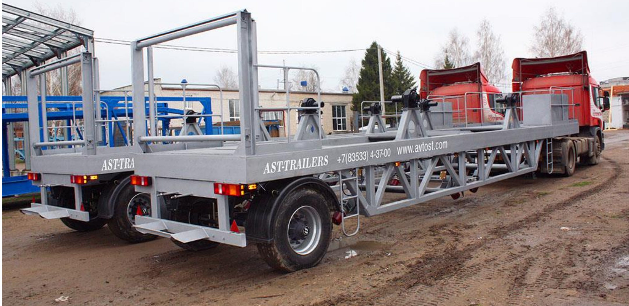
Полуприцеп 949166 (платформа)