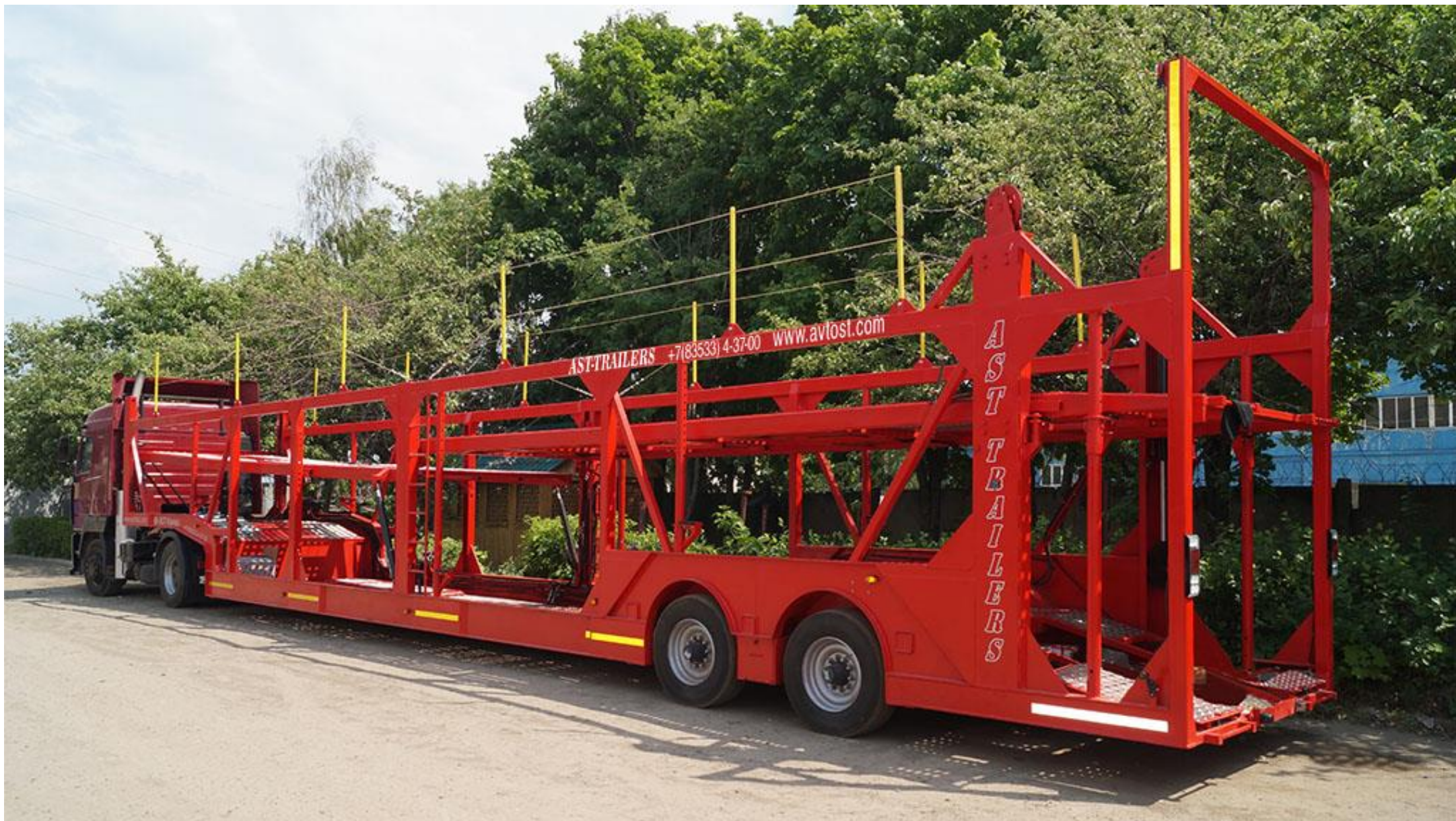
Полуприцеп АСТ 949222 (автовоз)