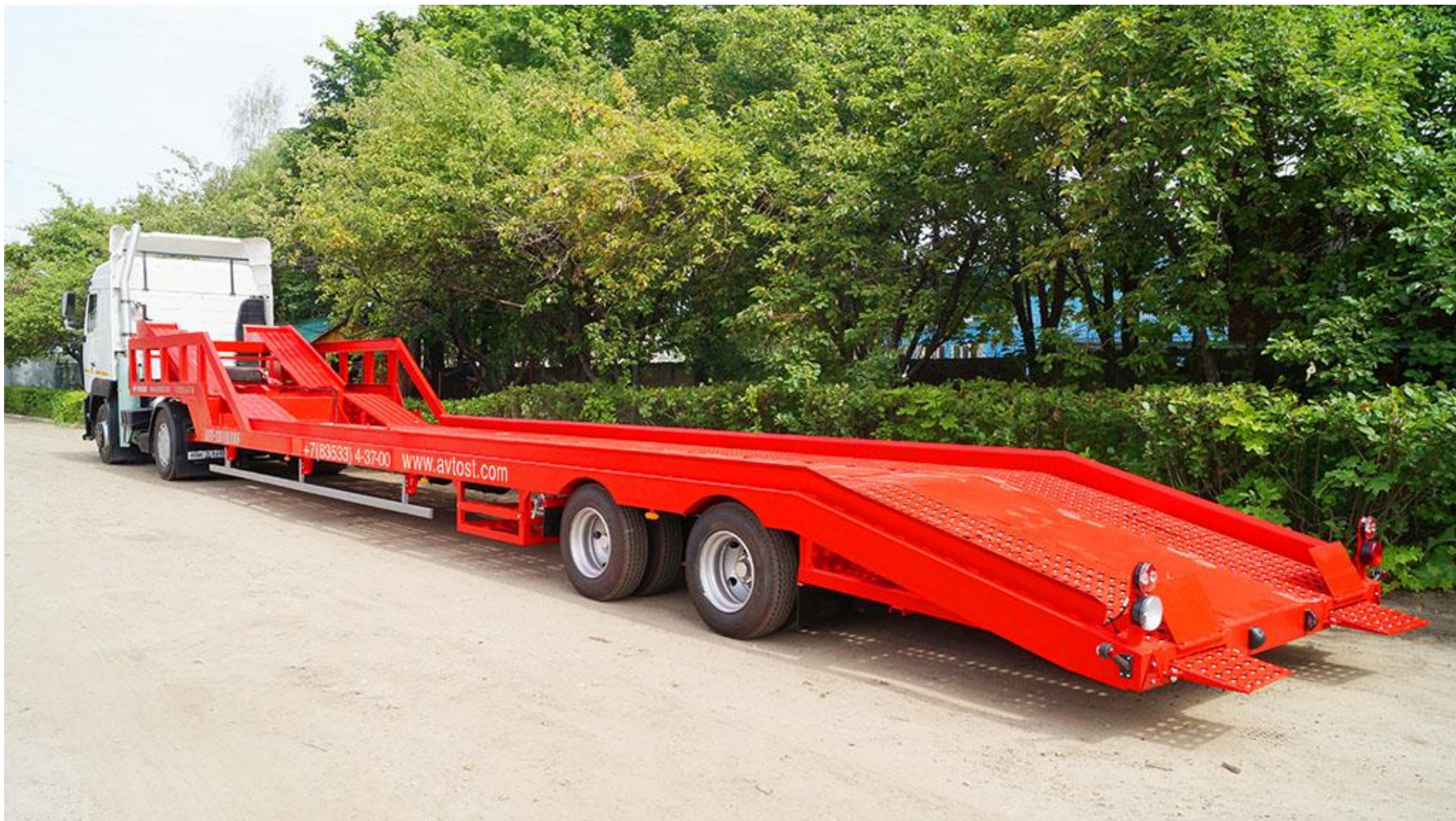
Полуприцеп 949221 (автовоз)