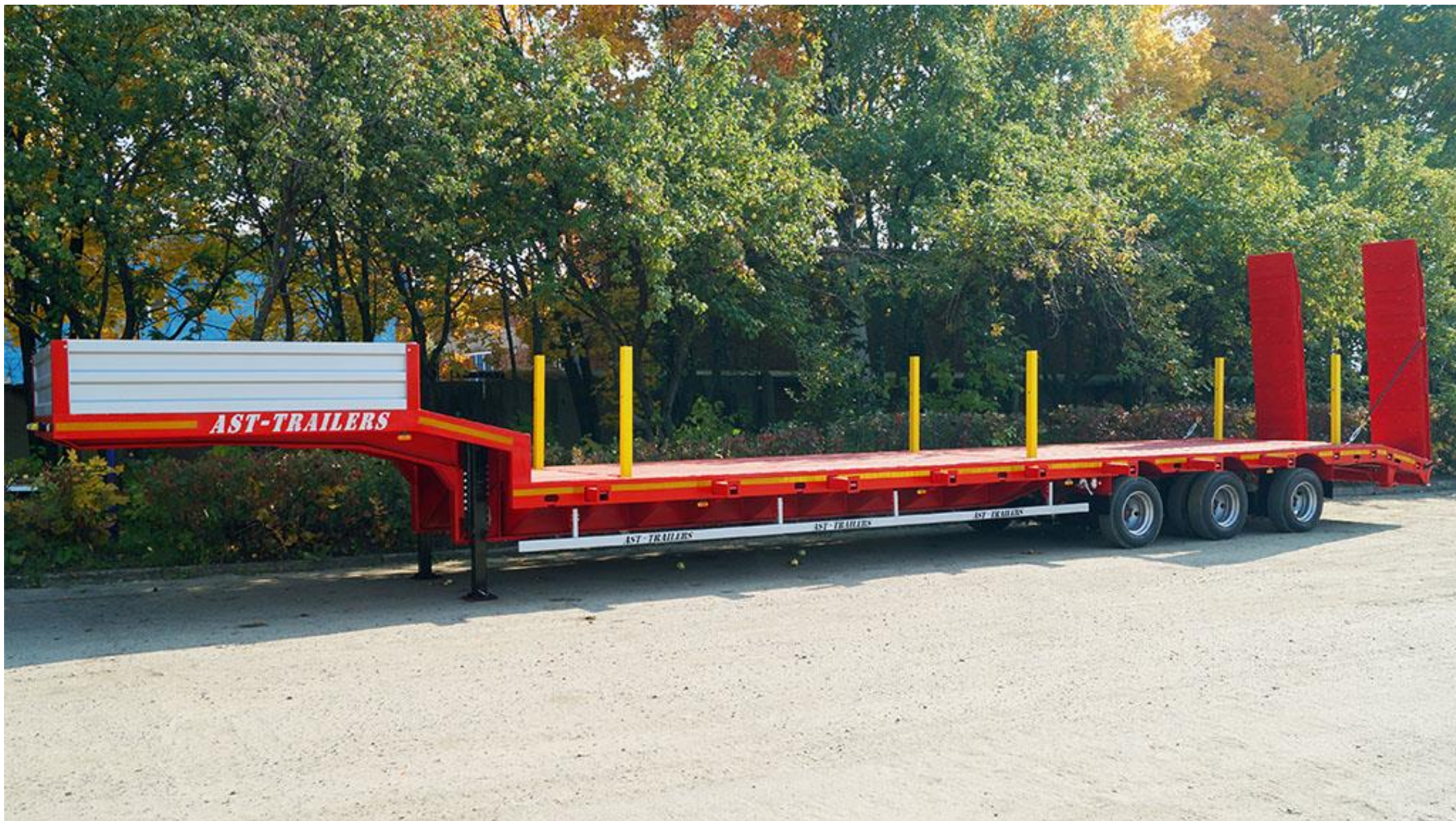
Полуприцеп 949133-03-09-38 (тяжеловоз)