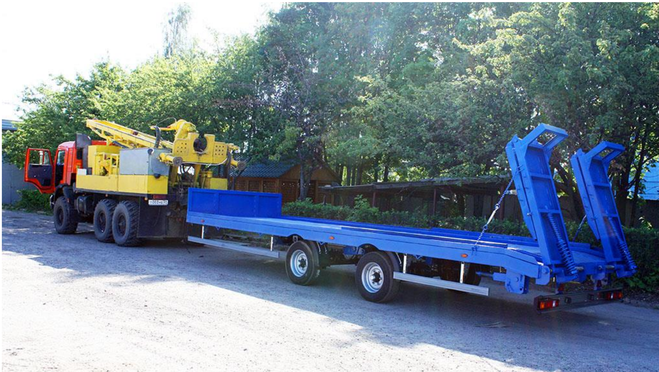
Прицеп 949124 (эвакуатор)