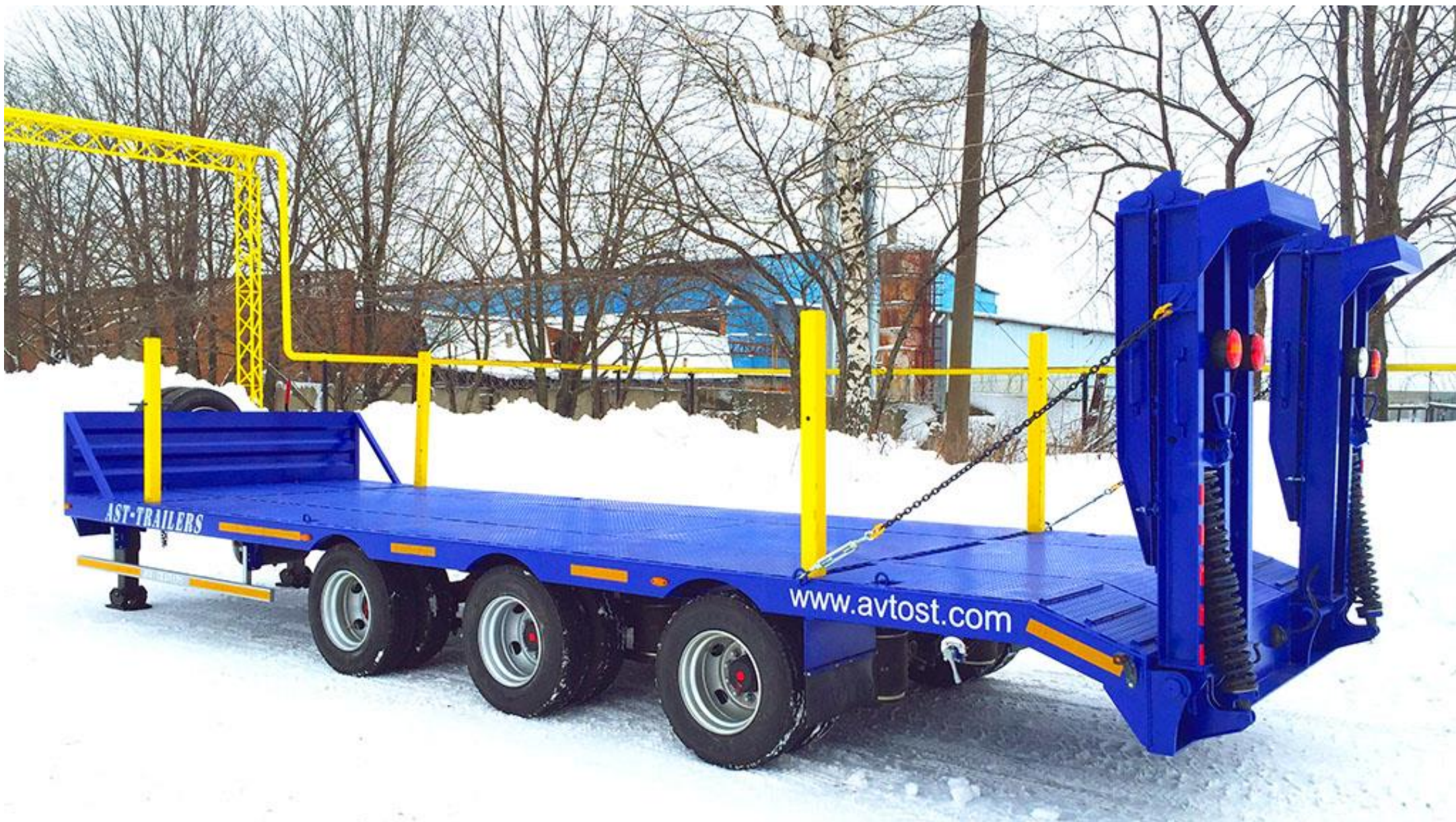
Прицеп 949124-3 (тяжеловоз)