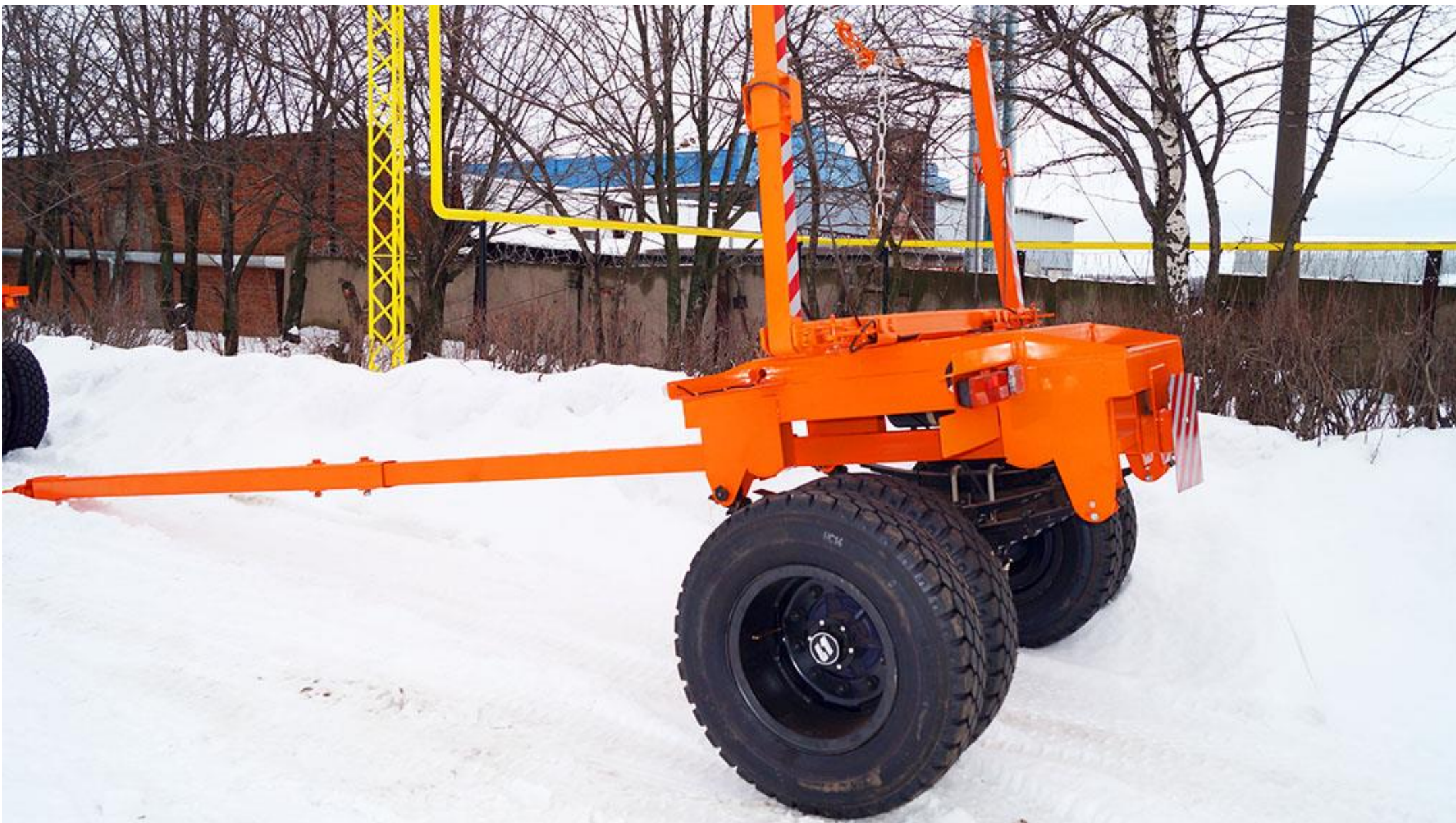
Прицеп 949173-Р5 (ропуск)