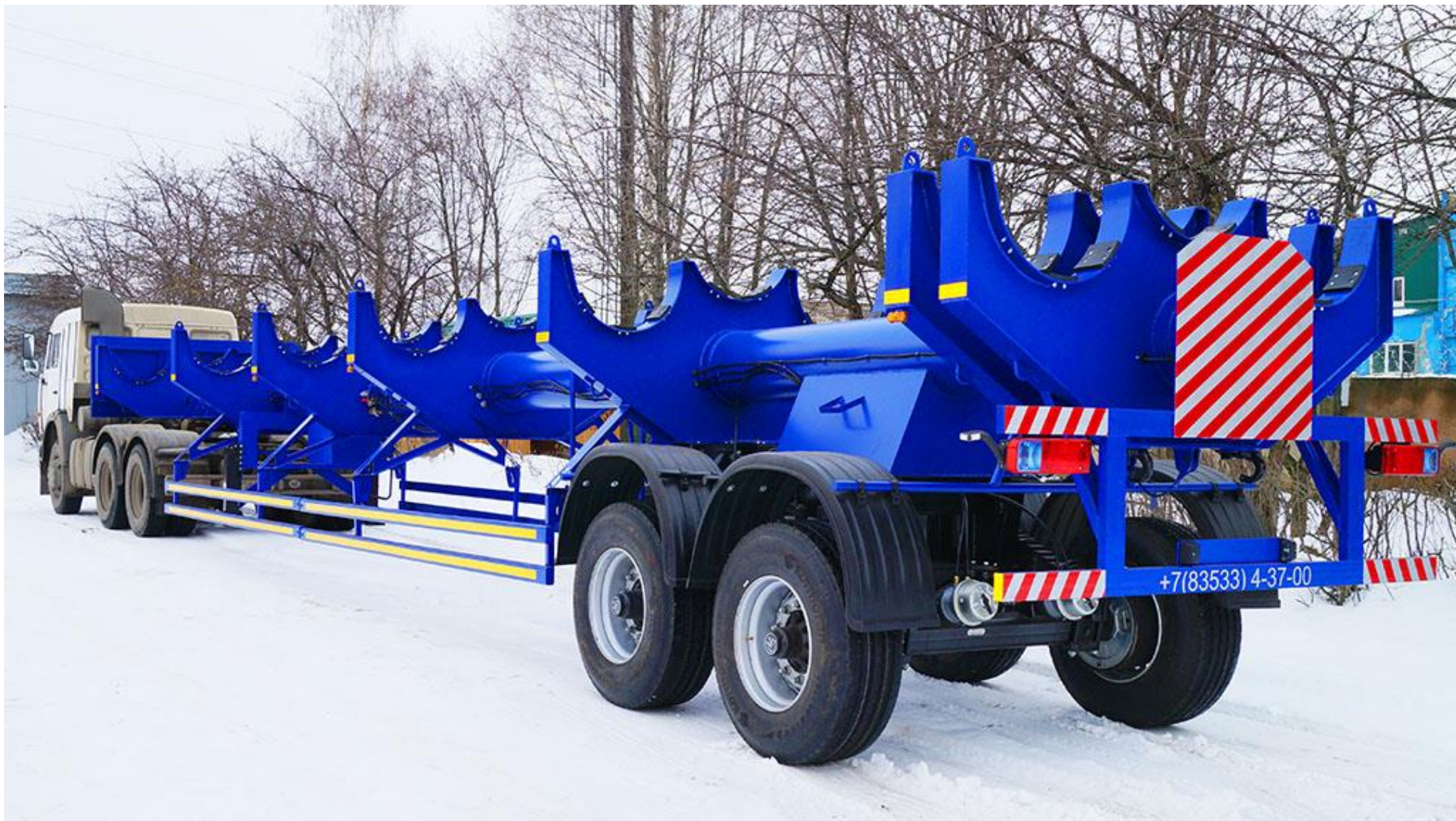
Полуприцеп 949167 (опоровоз)