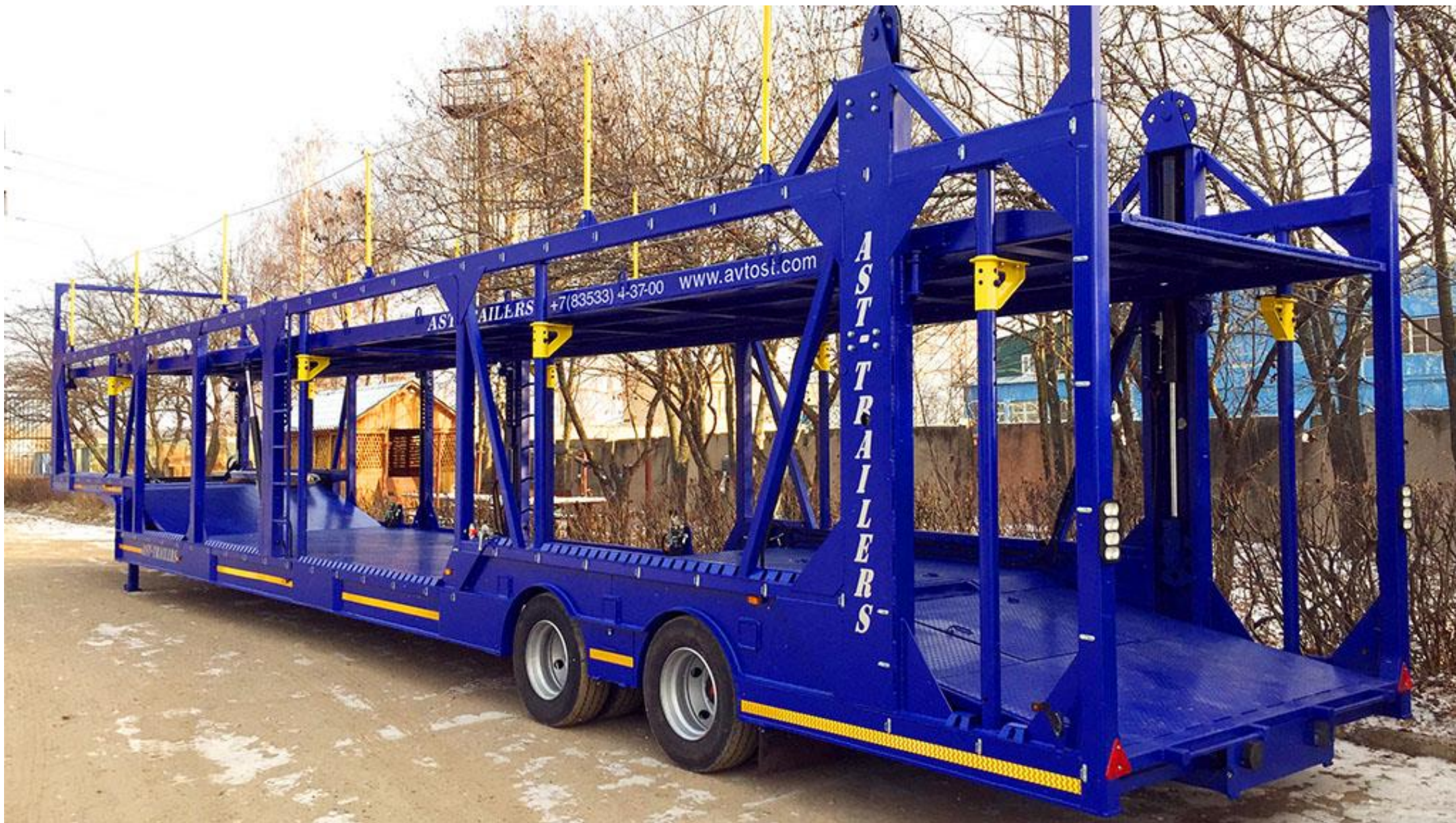
Полуприцеп АСТ 949220-01 (автовоз)