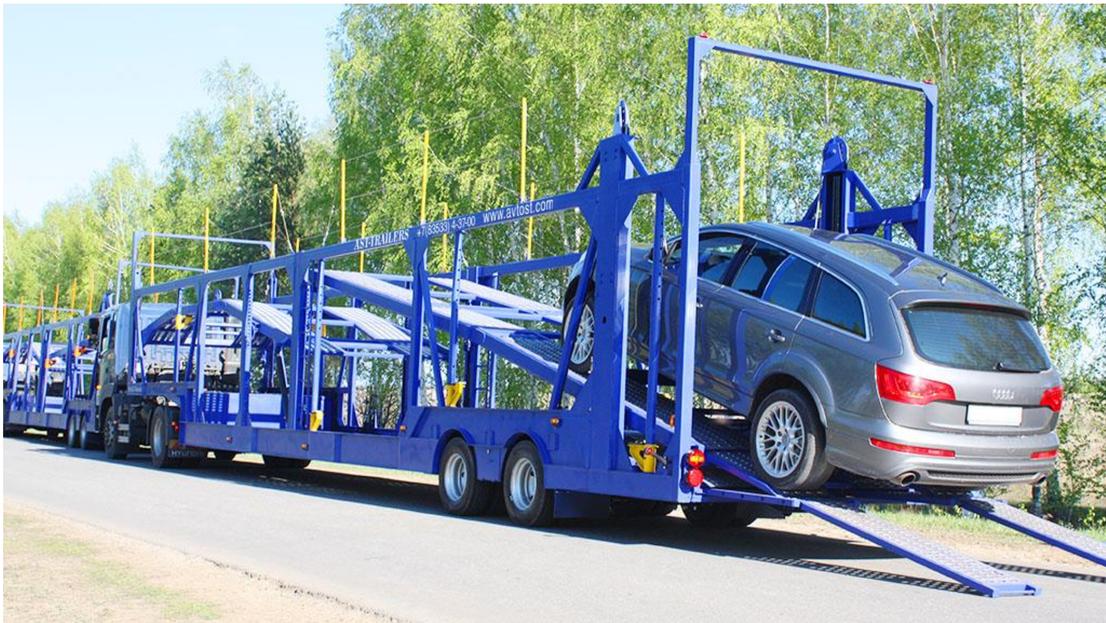
Полуприцеп АСТ 949220 (автовоз)